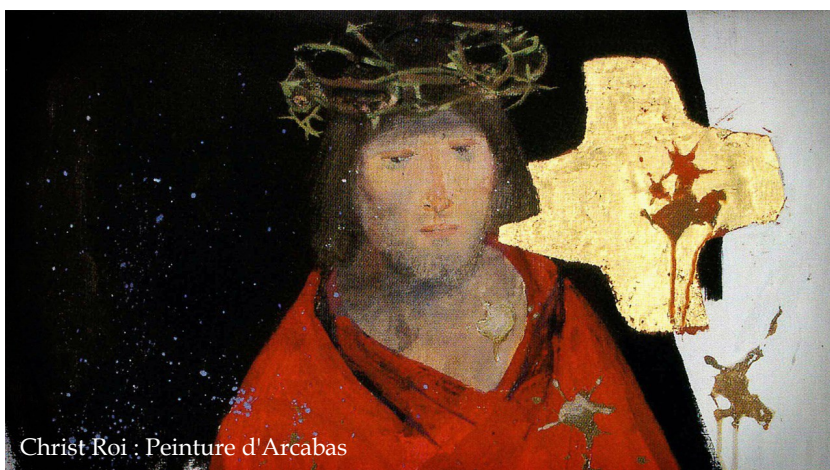
Christ Roi : Peinture d'Arcabas