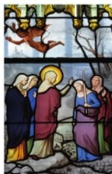
Parole et Silence