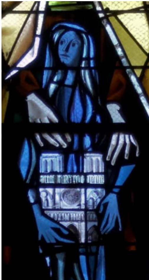
420-2020 - Jubilé de Sainte Geneviève, Sainte patronne de la Ville de Paris

Détail, vitrail - Saint-Pierre de Montmartre - Max Ingrand 1953