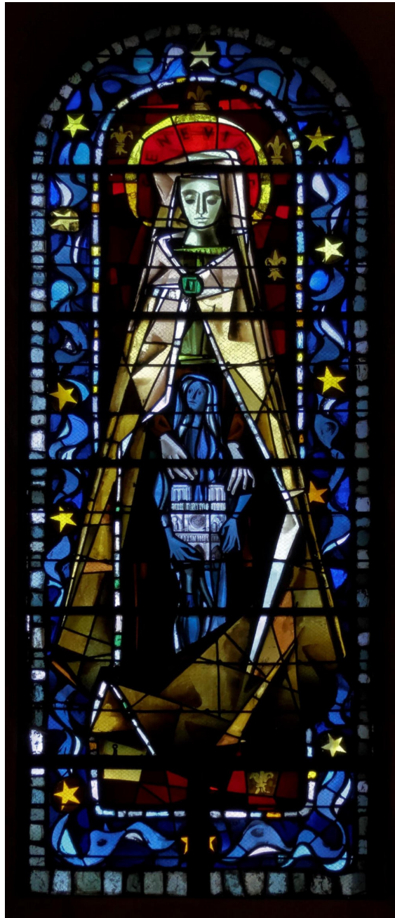
420-2020 - Jubilé de Sainte Geneviève, Sainte Patronne de la ville de Paris