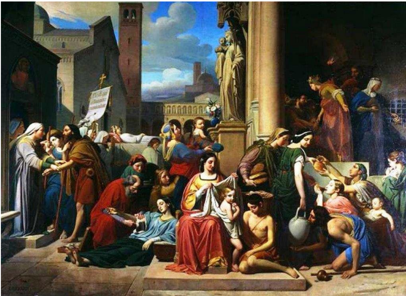
Les 7 œuvres de Miséricorde corporelle, par Jean-Louis Bézard.

«Et ils s'en iront, ceux-ci au châtement éternel, et les justes, à la vie éternelle.»