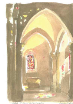
Les fonts baptismaux