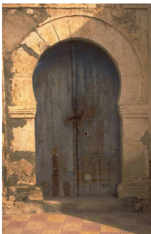
Une église près de chez vous: Pousser la porte

Se savoir baptisé exige de garder les commandements pour être, dans la vie quotidienne, témoin de cet amour universel. »