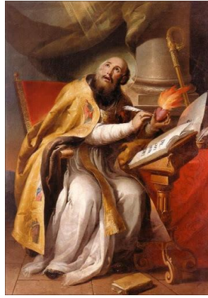
B. St Augustin