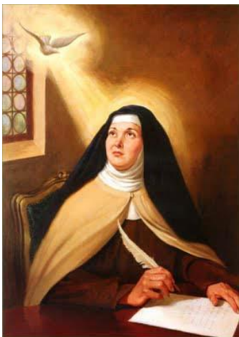
G. Ste Thérèse d'Avila