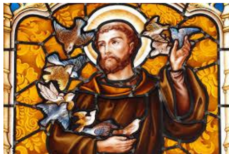
H. St François d'Assise