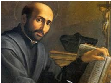
D. St Ignace de Loyola