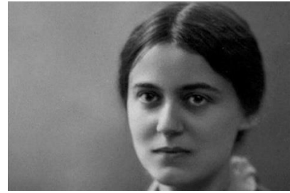
C. Ste Thérèse-Bénédicte de la Croix